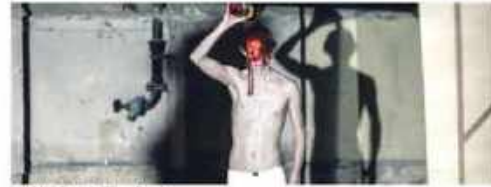
Průběh inscenace v inscenaci Destrukce.

K oncem třetího století v Druhé světové válce, v pozadí přetváří šloho zombiování, ale v hluboké rovině už jako by se v něm skrývaly všechny možnosti, jak se může svět změnit. V tomto smyslu je Destrukce románem, který se snaží být jakýmsi zrcadlem, které ukazuje, jak se svět může změnit, pokud se nám podaří vyhnout se tomu, co se děje nyní.