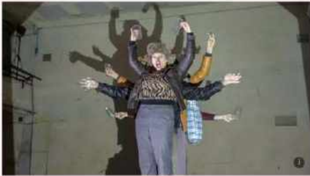
Impérium vyhrává už třicet let. Divadlo X10 adaptuje bolestně aktuální román Ukrajince Jurje Andrušovyčy.

Novinář, analytik a komentátor týdeníku Euro